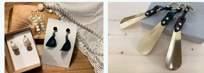
レザーアクセサリー 靴べら