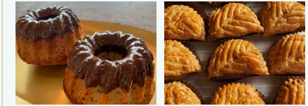
クグロフ 朝焼きアップルパイ

HansABOさんの工房からも近い、港南区笹下の洋菓子店、パティスリーアです。種類豊富な焼き菓子と、朝焼きアップルパイを販売させていただきます。おやつにぜひお立ち寄り下さい。