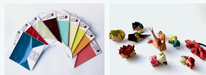
カードケースキット 革の折紙アクセサリー