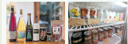
日本ワインやミード クラフトビール

栽培から醸造まで自然な造りにこだわる高品質な日本ワインをはじめ世界各国の美味しいワインや、普段の食卓をちょっぴり贅沢にしてくれる食材や商品を中心に販売しています。日本ワインをはじめ、国内で製造されているはちみつのお酒ミードや国産クラフトビールなどグラス提供させていただきます。