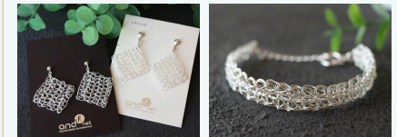
ピアス/イヤリング プレスレット

純銀線をかぎ針でレースのように編んだアクセサリーを作っています。使っている素材は、天然石や、淡水パール、スワロフスキーなど……。見た目は繊細けれど、存在感のあるアクセサリーです。お客様に永く愛されるアクセサリーになるよう、ひとつひとつ丁寧に製作を続けて参ります。