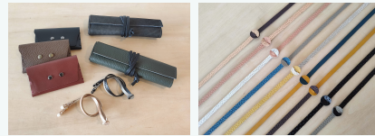
カードケース/ペンケース メガネストラップ