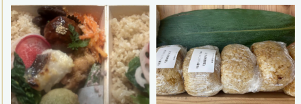
参加者のみなさんへ、こだわりのお弁当をお届け

こだわりのお弁当と、お惣菜、時々お菓子 許可のおりたキッチンで丁寧に作るお弁当やお惣菜、パーティーフードイベントを中心にいろいろなお会場にお届けしています。無農薬玄米とたくさんのおかずをぎゅっと盛り合わせたはすのは弁当は毎回完売です。