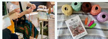
ワークショップ タッチングレースキット