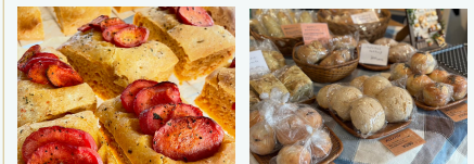
身体とココロに優しくほっこり笑顔になれるパン

「まごわやさしい」の食材をふんだんに使ったパンがオススメ！！ 毎日の食事に取り入れたい食材の頭文字を取ってつけられた合言葉。 子どもから大人まで安心して食べられるパンをお届けします。