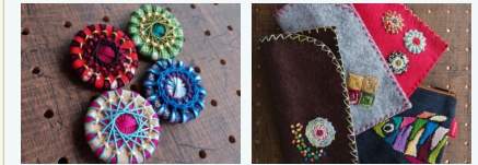
ハンドメイドボタン 織り刺繍雑貨

「染める、小さく織る、結ぶ、編む」の手仕事で日々の暮らしに寄り添うモノを作っています。今回は「織り刺繍」やヨーロッパに伝わるハンドメイドボタンをアレンジした作品を中心にお持ちします。